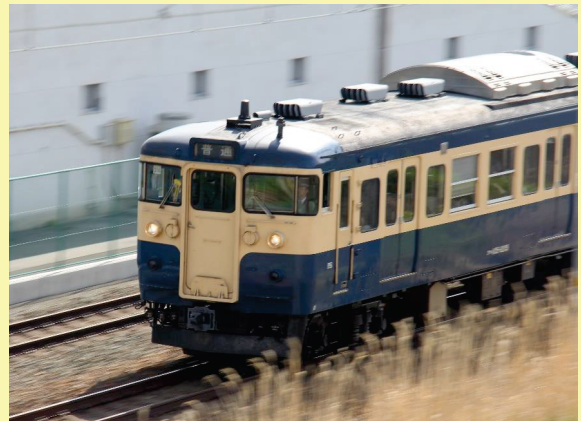
※使用車両イメージ (横須賀色で運転予定)