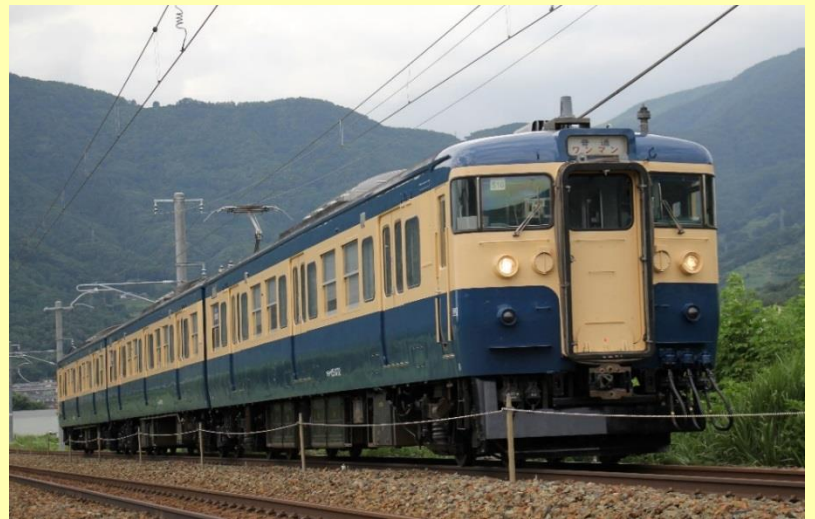
※使用車両イメージ (塗色変更車で運転予定)