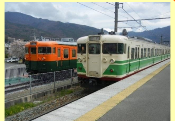
※坂城駅 169系電車との共演イメージ