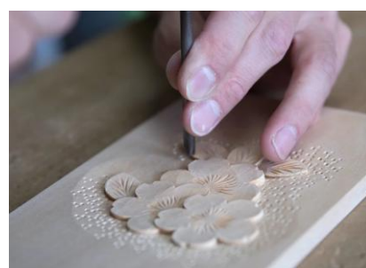
(9月)軽井沢彫り 体験イメージ 大坂屋家具店