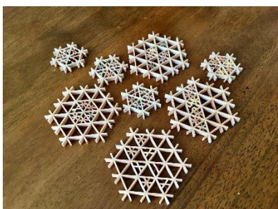
(8月)信州組子細工 体験イメージ 三浦木工