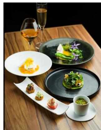
KOMORO HONJIN OMOYA(株式会社藤屋) 料理イメージ