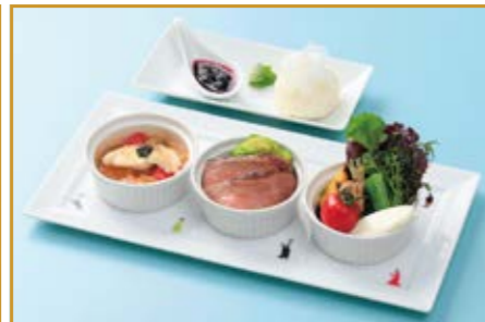
アトリエ・ド・フロマージュ(東御市) メイン料理・デザート