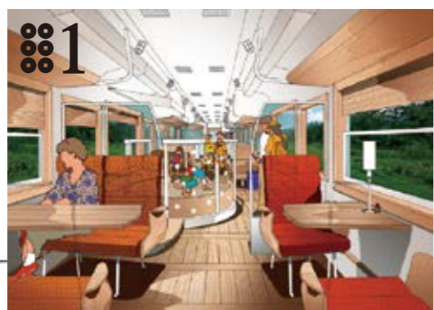
1号車(24席):乗車券+指定席プランのみ