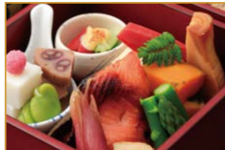
小布施 鈴花(小布施町) 懐石料理