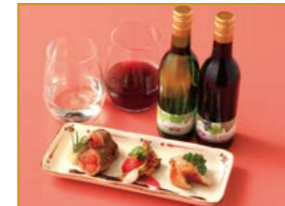
オーベルジュ タキモト(山ノ内町) 信州ワインと料理のマリアージュ