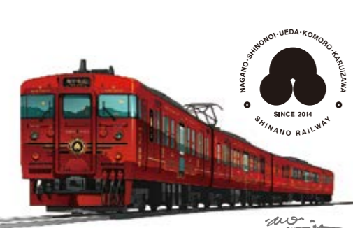
Illustration & Design by Eiji Mitooka + Don Design Associates

1号車は、ファミリーやグループ向けの車両です。2人・4人掛けの対面席やソファ席、中央には木のボールに埋まって遊べる「木のボール」を設置。サービスカウンターでは、飲み物やグッズを販売。おとなも子どもも楽しめる空間です。