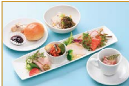
沢屋「こどう」(軽井沢町) 前菜・スープ・ご飯又はパン