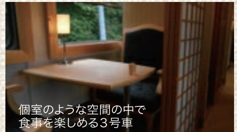
個室のような空間の中で 食事を楽しめる3号車