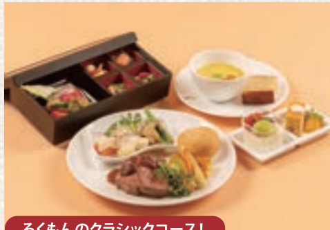
ろくもんのクラシックコース!