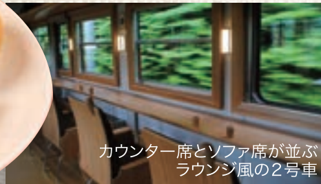
カウンター席とソファ席が並ぶ ラウンジ風の2号車