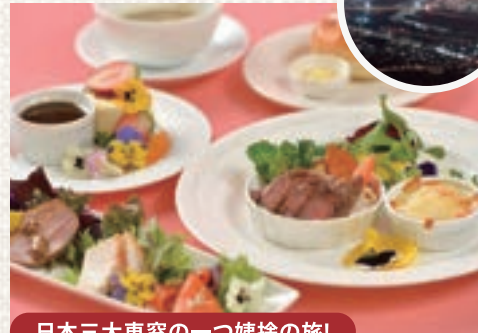
日本三大車窓の一つ姨捨の旅!