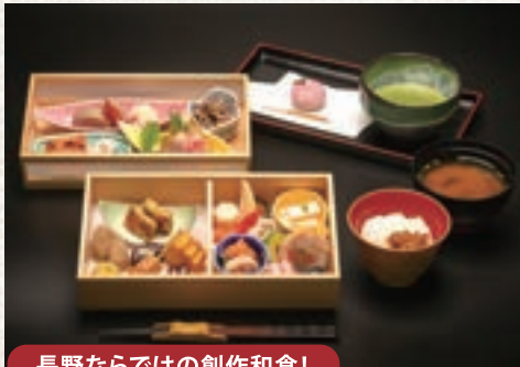
長野ならではの創作和食!