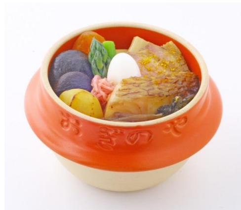
▲ 春節特製弁当 峠の釜めし