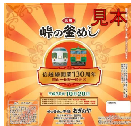
▲ 10月20日掛け紙デザイン