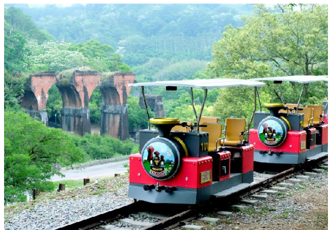
▲ 旧山線レールバイク