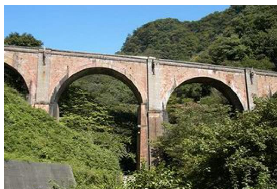
▲ めがね橋(碓氷第三橋梁)