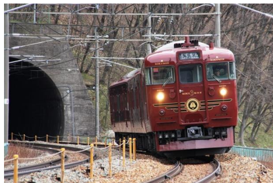
▲ 観光列車「ろくもん」