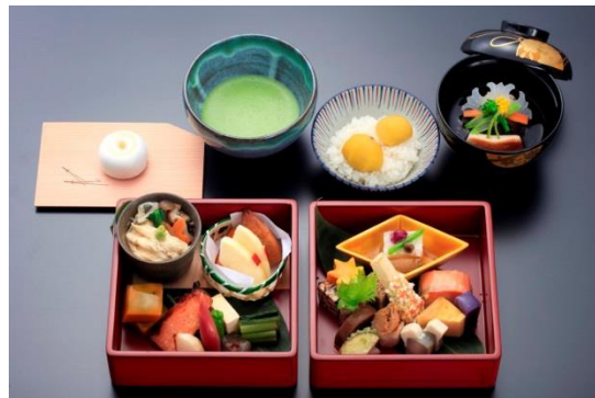
▲ 「ろくもん」車内で提供されている小布施 鈴花の料理 ※イベントで提供される内容とは異なります。