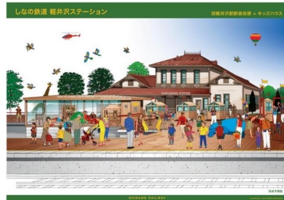
(旧駅舎ロゾーン完成イメージ)