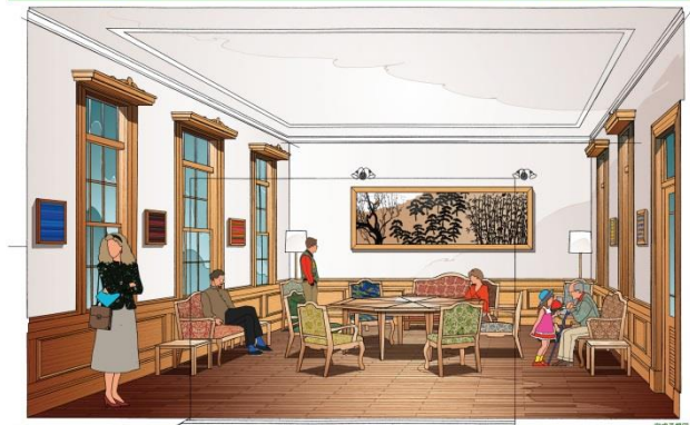
(ろくもんラウンジイメージ)