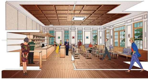
(桜井甘精堂 茶菓幾右衛門イメージ)