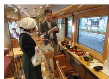
【田中駅停車中】 お土産品の手渡し(2号)