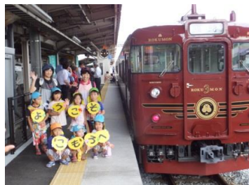
【小諸駅】 地元保育園児による歓迎