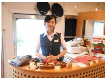
【車内】 上田紬製品、オリジナルグッズ等の販売