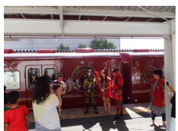
【上田駅】 甲冑駅長による記念撮影