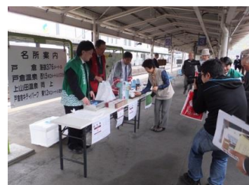
【戸倉駅】 温泉茶振舞い、特製まんじゅう販売