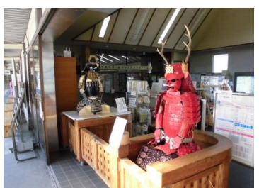
【屋代駅】 地元高校生の制作による紙甲冑の展示