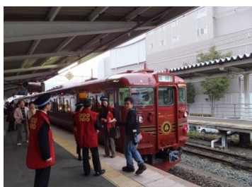
【上田駅】 陣羽織着用記念撮影