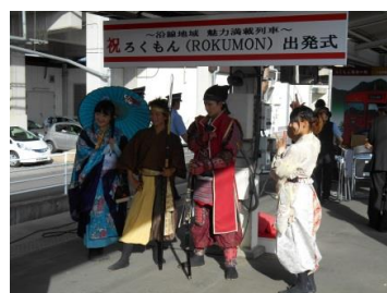
【上田駅】 おもてなし武将隊出演