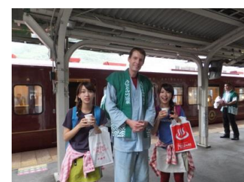
【戸倉駅】 観光協会、旅館組合によるパンフレット配布