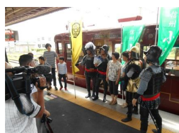
【小諸駅】 センゴク甲冑隊による歓迎