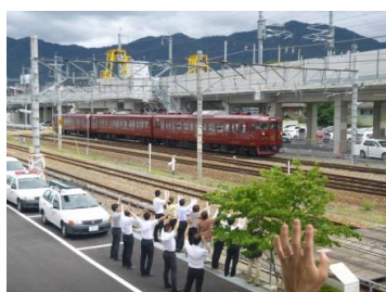
【しなの鉄道本社前】 社員による歓迎手振り