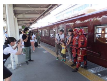
【上田駅】 上田城甲冑隊