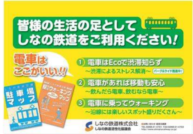
しのの鉄道(利用促進PR)