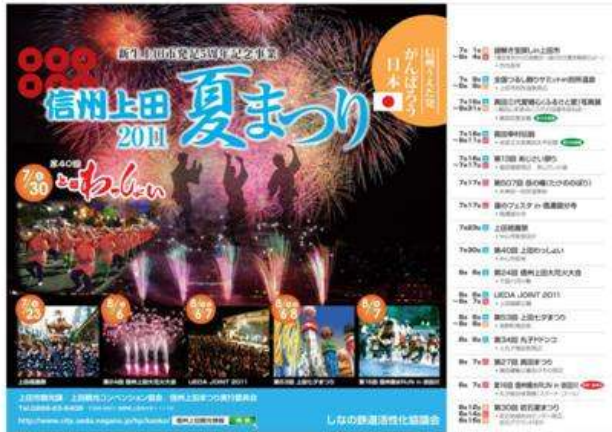
上田市(信州上田夏まつり)