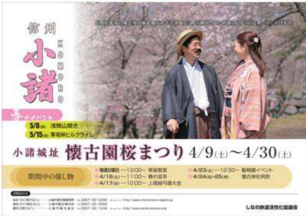
小諸市(小諸城址懐古園桜まつり)