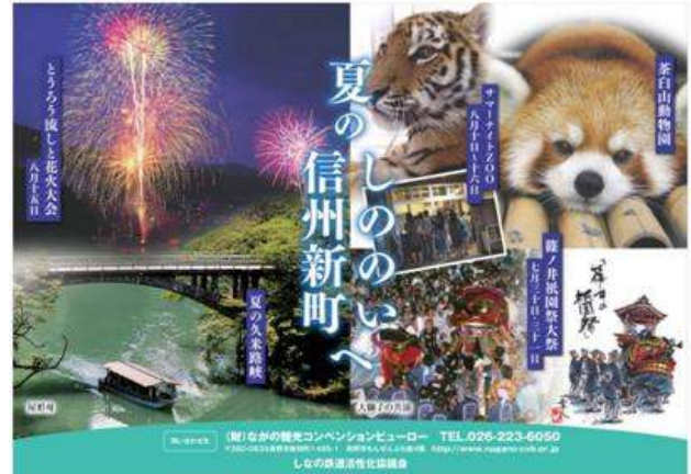
長野市(篠ノ井・信州新町イヤー夏のイベント)