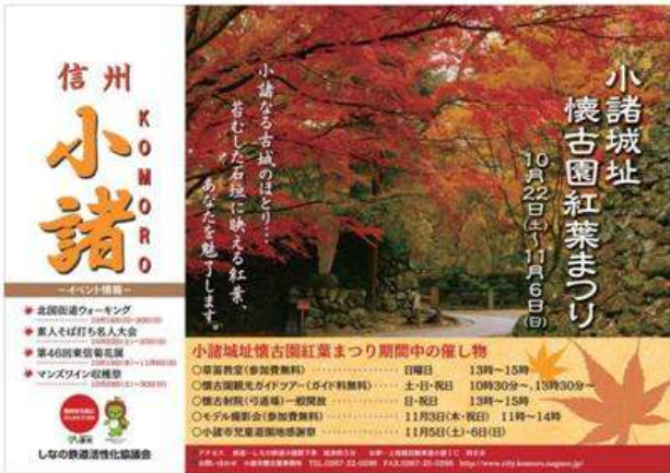
小諸市(小諸城址懐古園紅葉まつり)