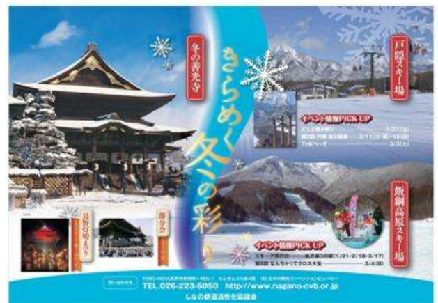
長野市(篠ノ井・信州新町イヤー冬のイベント)