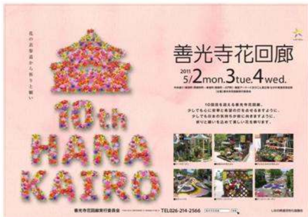
善光寺花回廊実行委員会(善光寺花回廊)