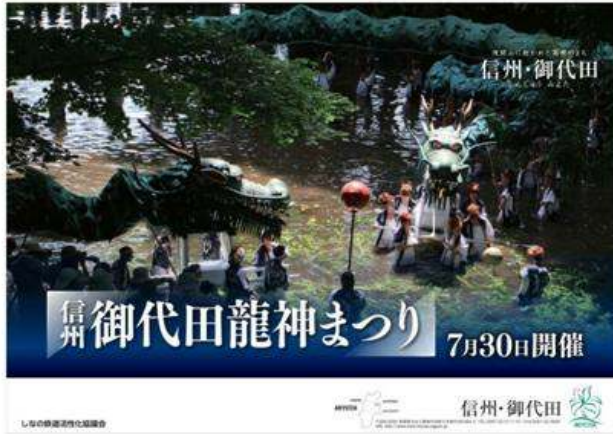
御代田町(信州・御代田龍神まつり)