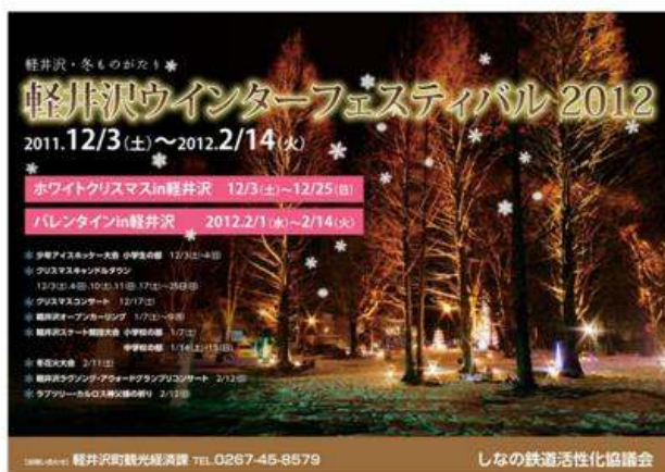
軽井沢町(ウインターフェスティバル)