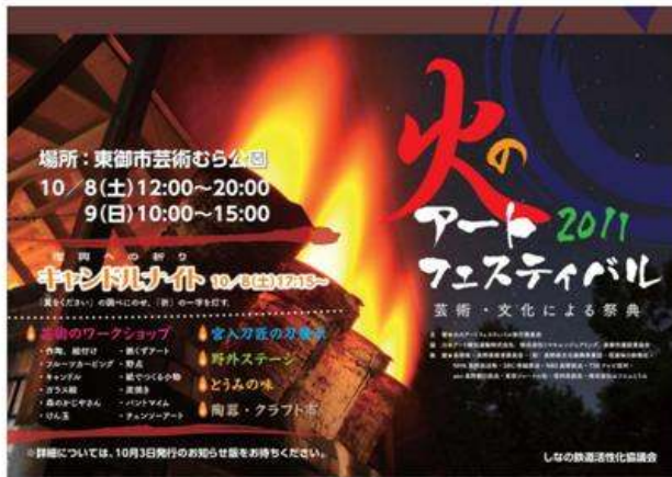
東御市(火の芸術フェスティバル)