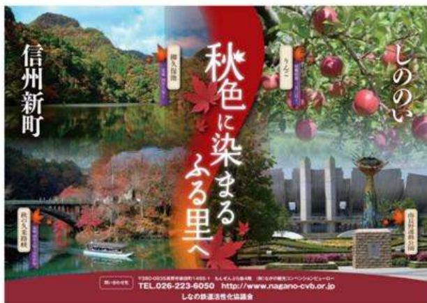
長野市(篠ノ井・信州新町イヤー秋のイベント)