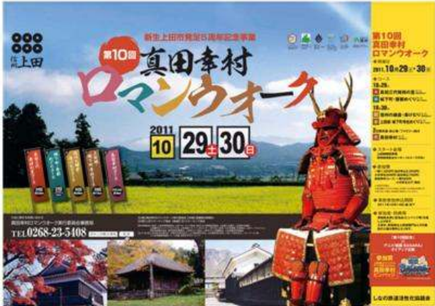
上田市(真田幸村ロマンウオーク)