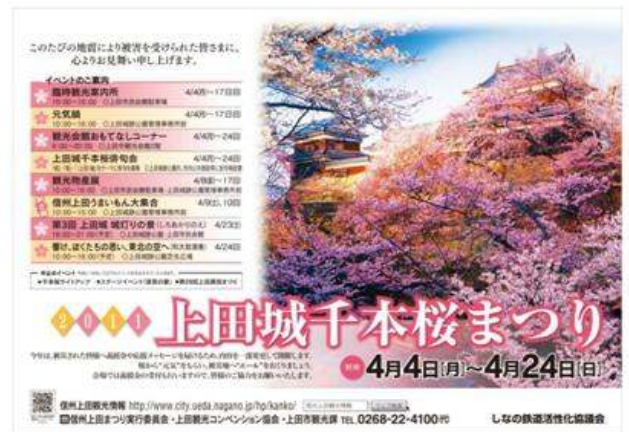
上田市(信州上田千本桜まつり)