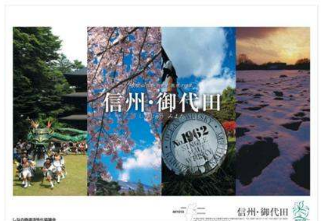
御代田町