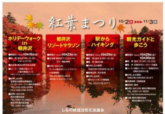
軽井沢町(紅葉まつり)