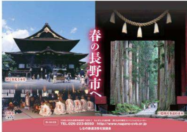
長野市(篠ノ井・信州新町イヤー春のイベント)