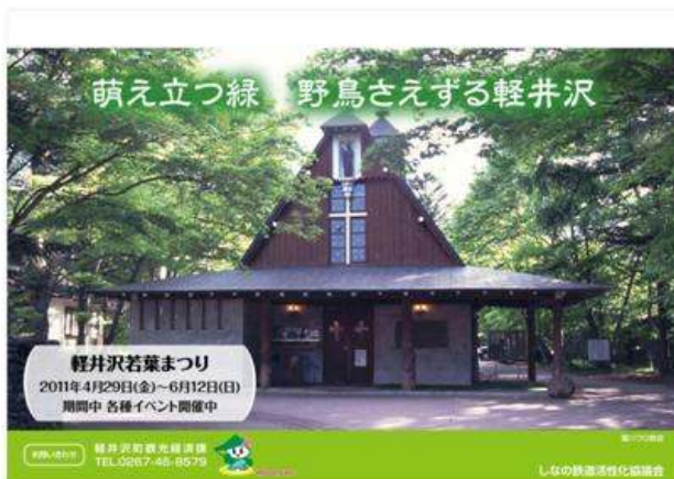
軽井沢町(若葉まつり)