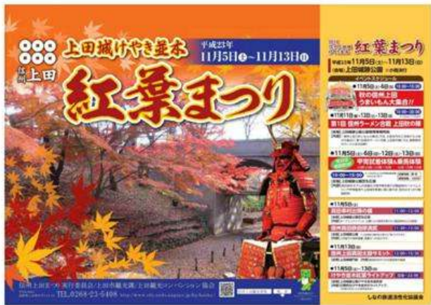
上田市(信州上田城けやき並木紅葉まつり)