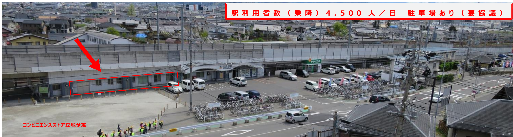
コンビニエンスストア立地予定